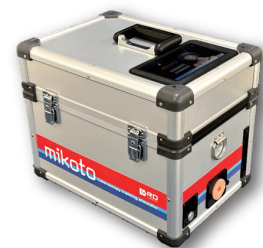
「mikoto」大腸内視鏡モデル

令和5年6月15日に製品発表を実施。 令和5年11月時点で数十台の国内販売を実現。